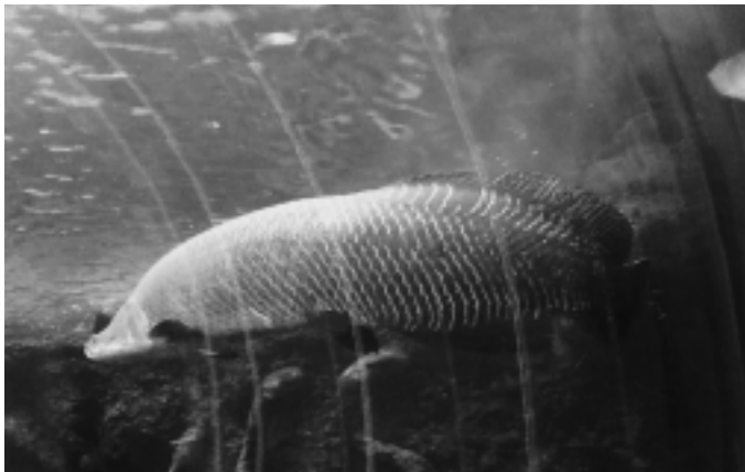
▲世界の最大級の淡水魚 アマゾンに住むピラルクー