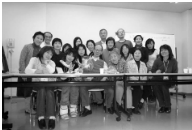
▲心開いて楽しみながら手話タッチ！

市難聴協会では毎年市の委託を受け手話教室を開いておりますが、継続しないと身につかないため、有志で月に一回手話勉強会を開いています。それが『手話