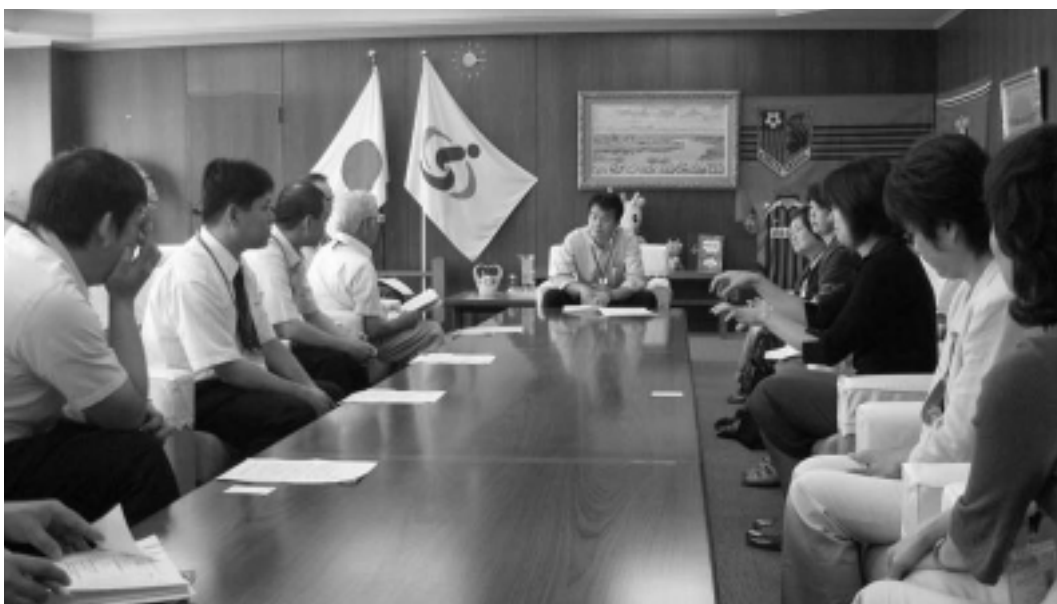
▲清水市長に迎えられて市長室へ。ほとんどの人が初めての体験でした。

り使いやすく有効に活用するために、後見報酬に公的補助をつけてください。 四、移動手段として自家用車を利用することを余儀なくされている障害者や家族にガソリン代を補助する制度について、家族が運転する場合の年齢制限条項を撤廃してください。