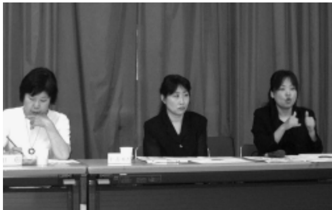
▲障協理事会でも、2時間の手話通訳はハードです。

理由は登録手話通訳者の労働性を認めず、雇用されて指揮命令を受けて働くのではなく、手話通訳の依頼に対して自由に承諾、拒否ができるというものであり、もう一つは手話通訳の時間というものを限定的に解釈し、手話通訳者の働く内容