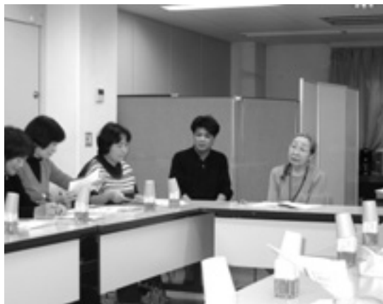
▲池並施設長の元気に圧倒されて…

施設長さんのお話の中で、七ヶ所目のホーム建設予定を変更し、今まで与えていただいていたばかりでしたので、今度は地域の皆さんに喜んでいただけるように協力していきたいと考え、地域の皆さんと共に活動出来る場所としての施設を考慮中。そして、ぶれない諦めない、を基本理念