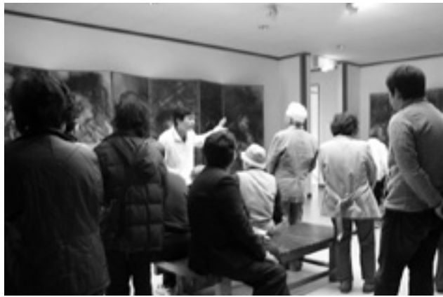
▲丸木美術館一原爆の図の説明を受けて。