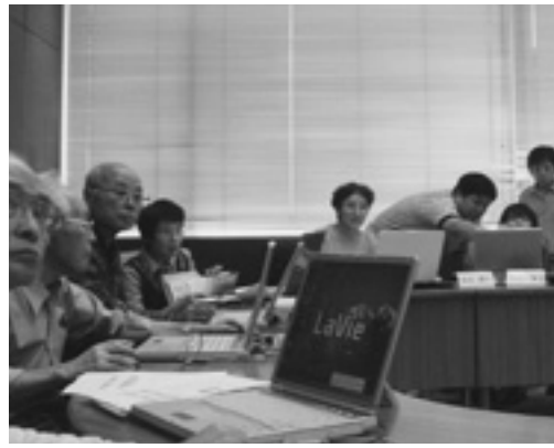
▲教えることを目的にパソコン教室