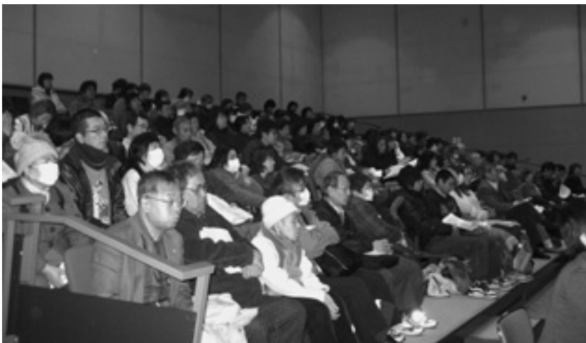
▲第14回学習フォーラムで熱心に学習するみなさん