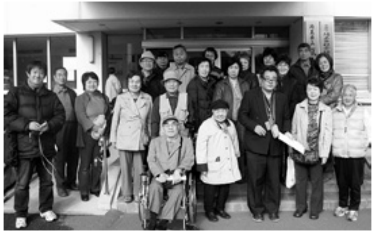
▲参加者のみなさん

定する知的障害児施設、及び重症心身障害児施設、また医療法に規定する病院の複合施設があり、知的障害者及び身体障害者の福祉の増進を図ることを目的とした、大規模な施設でした。 施設の概要を聞いた後で、広大な敷地に点在する施設をいくつか案内していただきながら、さいたま市内にある小規模作業所との落差を思っていました。 障害者が何種類かの手仕事にせつせと勤しむ様子を見たり、ケアホームの近くで仲間と楽しそうに会話をしながら散歩をしている姿に出会いましたが、のびのびと生活していることが感じられました。