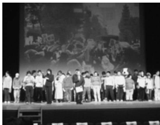
▲施設利用者のうたごえの中で（県民集会）