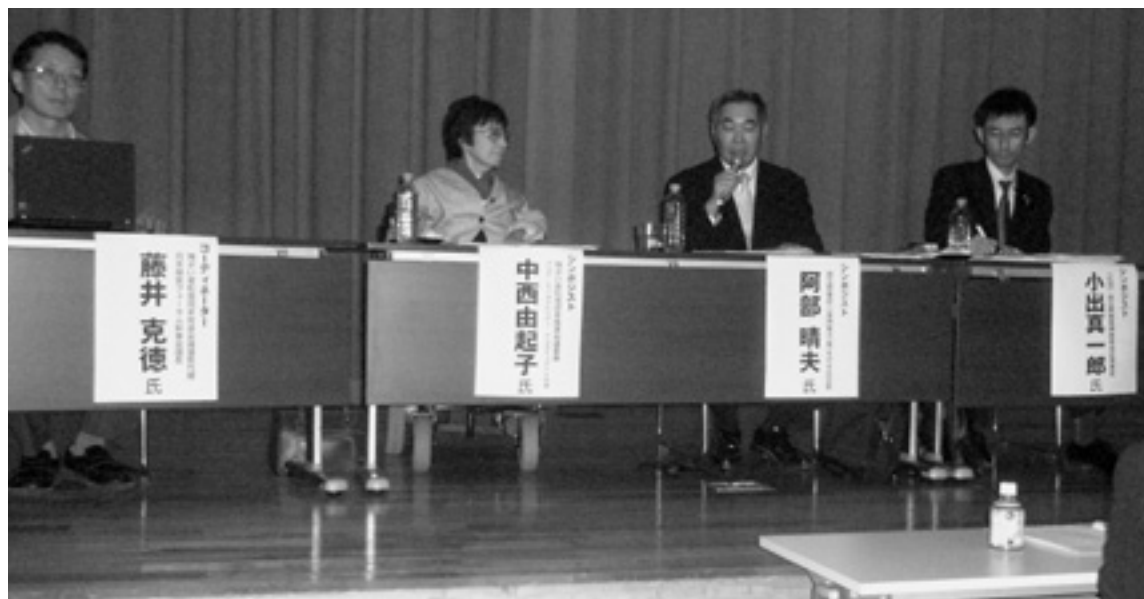
▲2010年11月14日に行なわれた内閣府主催の地域フォーラム。参加者があふれていました。