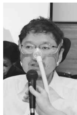
埼玉県筋ジストロフィー協会