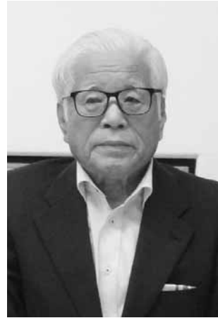
さいたま市身体障害者福祉協会