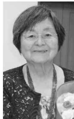
さいたま市手をつなぐ育成会