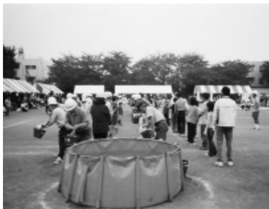
緑区バケツリレーの様子

この訓練は、地域住民と区職員が連携した防災訓練を実施することにより、緑区の防災力向上と住民意識の高揚、