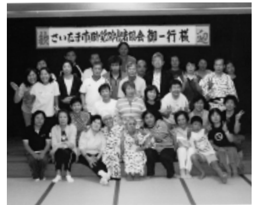
大広間で記念撮影