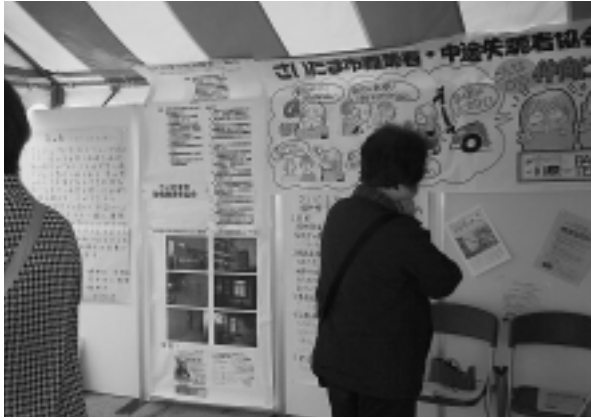
さいたま市障害者協議会各団体の展示