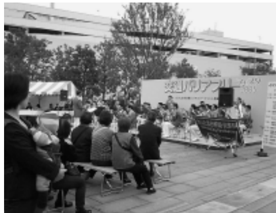
さいたま市消防音楽隊の演奏

たけど、会場の使い方にもっと工夫があつてよかつたのではないかとという意見がありました。 まだまだバリアがある交通アクセス、理解が進むことを願っています。