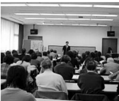
会場はたくさんの参加者で埋まりました