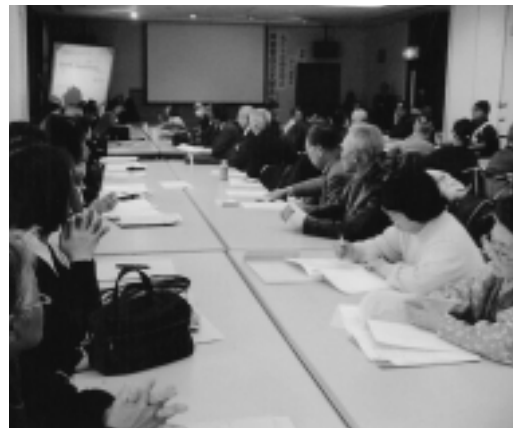
障害者自立支援法施行を前に多くの参加者が……

その他、会報の発行、年齢別のグループ活動、施設等の見学会、講演会、クリスマス会などを行っています。 旧浦和市で昭和六十二年に生まれた