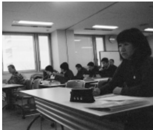
若いお父さんがいっぱい研修でした

性教育は「人間関係を学ぶこと」との 姿勢から始まり、本人の年齢を基本に置 き、家庭の中では性差により距離を置く ことが重要と話され「お母さんは全女性 の代表であり、子供はお母さんをおし て女性を見る」とのお話は、本人を異性