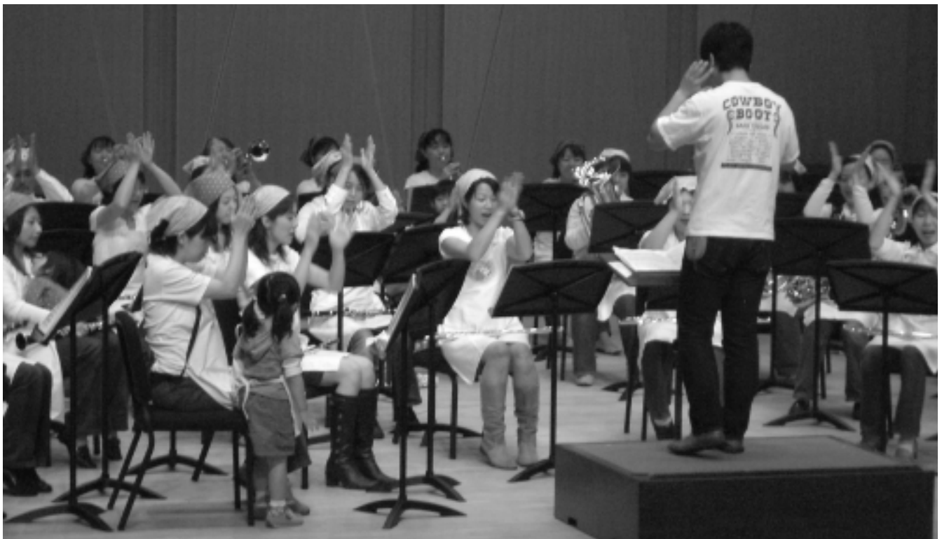
企画プログラムの1番バッター「たまびよ隊」の吹奏楽。楽しい雰囲気が会場いっぱいにあふれました。