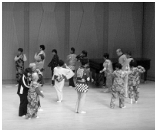
みんないっしょに「ズンドコ、ズンドコ」

今回、市民の集いに出演のお話をいただいたとき、「しびらき」の人たちといっしょに踊る