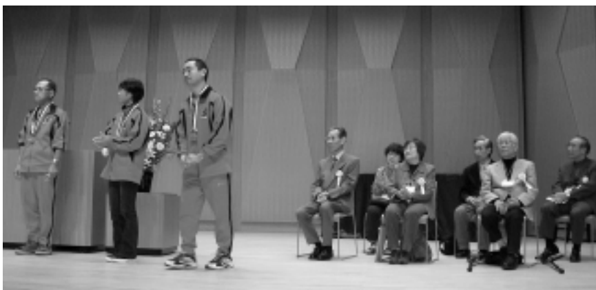
10月に行なわれた全国障害者スポーツ大会参加の選手から報告がありました

「予算の問題」 そう思っても予算がありません。専門的 ん、人手もありません。専門的 中途障害の問題など、明日は わが身かもしれない。でも障害 を持って生きるということがど んなことか、知っていたきた いのです。