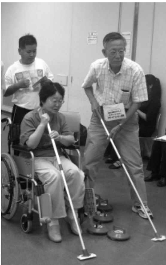
上 車いすでもできるカーリング

ーバルボール、スカットボール、フライングディスク、ボックス（ホッケー）の用具が設えられ、スポーツ指導員と同、ボランティアが各々を担当、ルールの説明と模範演技がありました。 参集のみなさんは、興味津々、思いおもいの種目に真剣な面持ちで挑戦、「全種目制覇」を目標に取り組む様子がみられました。