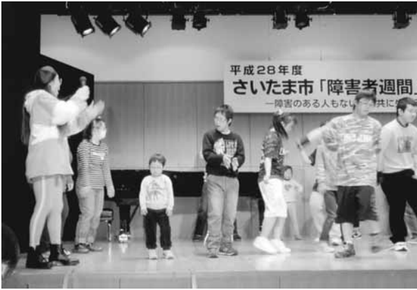
いっしょに楽しく踊れたね