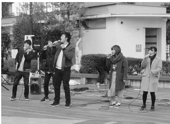
埼玉大学 アカベラサークル CHOCOLETZ