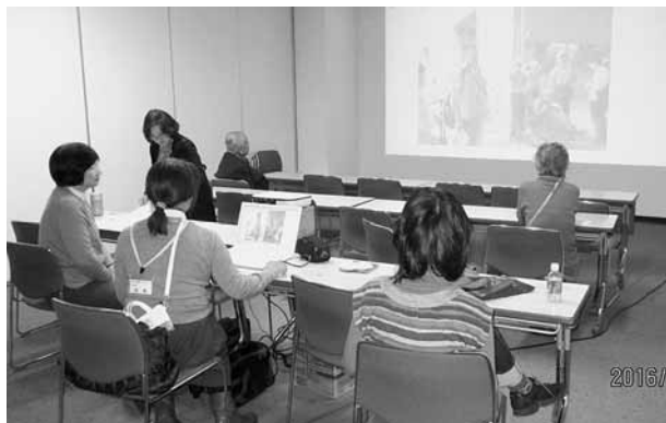
手をつなぐ育成会 「会の活動や障害特性の解説と体験」