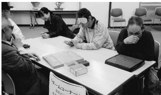
さいたま市視覚障害者福祉協会 「囲碁・将棋」