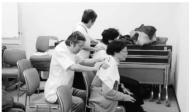
さいたま市視覚障害者福祉協会 「点字・マッサージ」