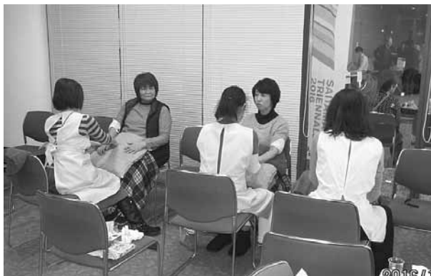
埼玉県筋ジストロフィー協会 「アロママッサージ」