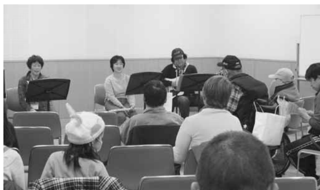
埼玉県自閉症協会さいたま地区 「歌・童謡」

さいたま市障害者生活支援センターと さいたま市消費者生活総合支援センター による「出張相談」