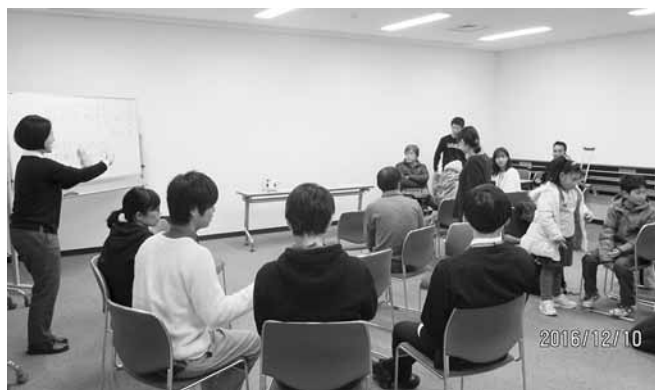
さいたま市聴覚障害者協会 「手話教室と体験」