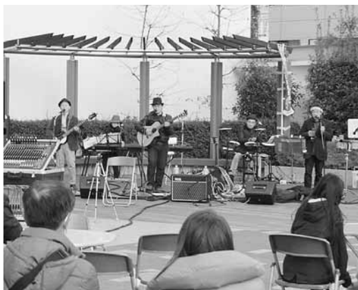
ザ山崎ブラザーズバンド