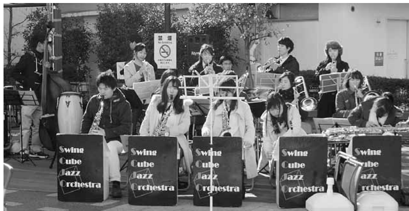
埼玉大学 Swing Cube Jazz Orchestra White Band