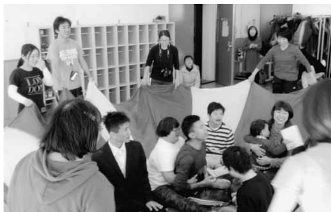
さいたま市ダウン症連絡会