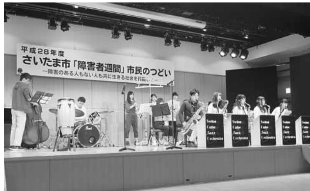
埼玉大学 Swing Cube Jazz Orchestra White Band