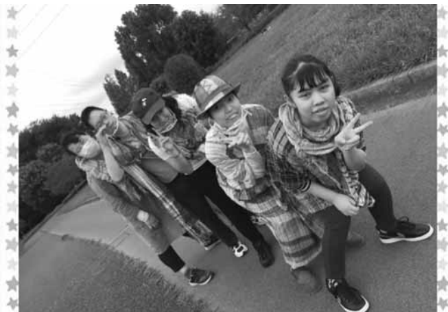
NPO 法人織の音アート・福祉協会