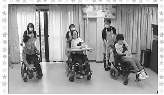
社会福祉法人 いーはとーぶ