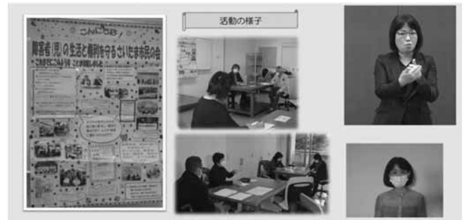
こんにちは。障害者の生活と権利を守るさいたま市民の会です。