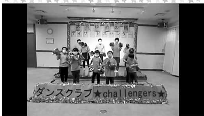
社会福祉法人ハッピーネット大宮ゆめの園 デイサービスセンター