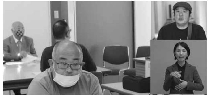
さいたま市精神障害当事者会 ウィーズ