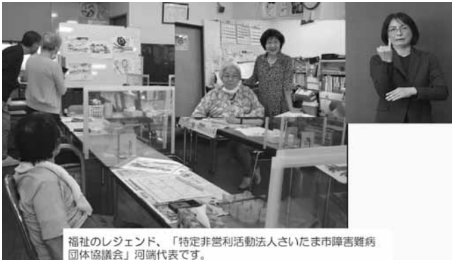
NPO 法人さいたま市障害難病団体協議会