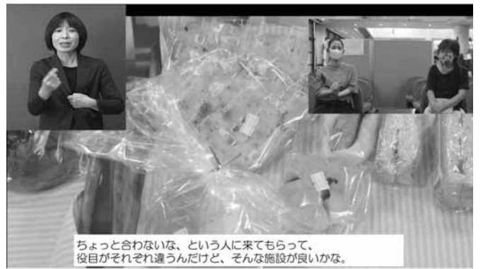
一般社団法人みっくすピート