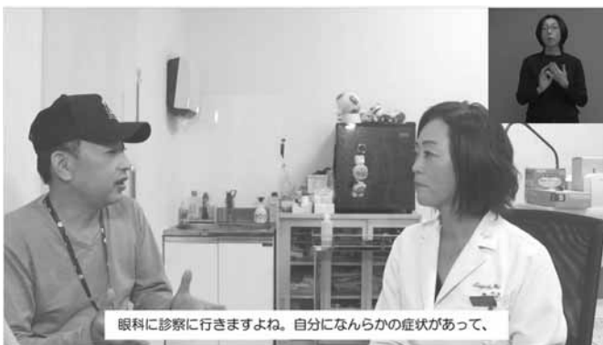
ロービジョンラボ (Next eyes lab)