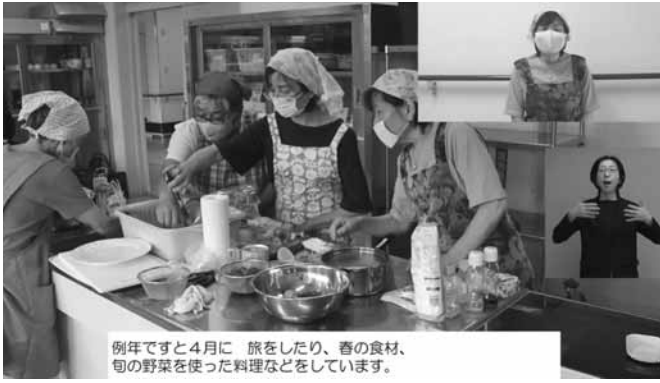
さいたま市身体障害者福祉協会