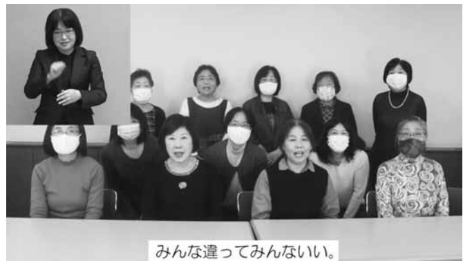
一般社団法人さいたま市手をつなぐ育成会