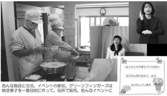
一般社団法人ノーマライズうらわ