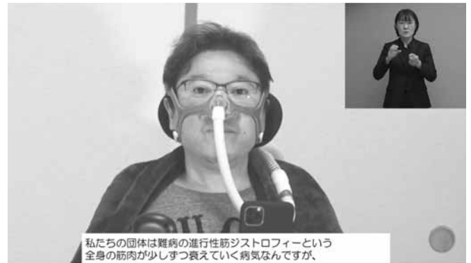
私たちの団体は難病の進行性筋ジストロフィーという全身の筋肉が少しずつ衰えていく病気なんです、