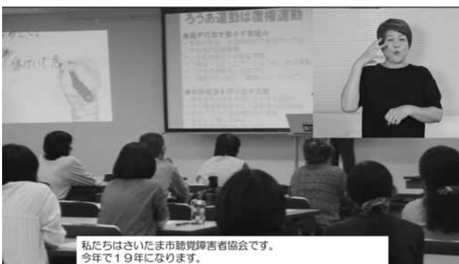
私たちはさいたま市聴覚障害者協会です。今年で19年になります。