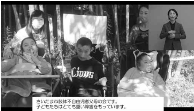
さいたま市肢体不自由児者父母の会です。子どもたちはとても重い障害をもっています。