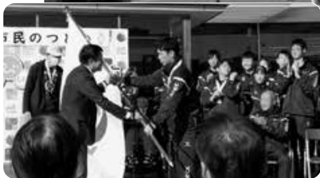
清水市長への団旗の返還