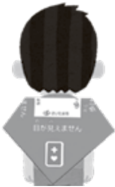
災害時障害者支援用バンダナ

↓(市回答) 障害者用バンダナについて、事務的なことで納期が間に合わず申し訳なく思っている。年度内には完成させる予定でいる。