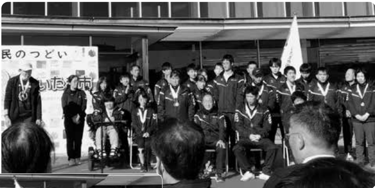
さいたま市選手団の解団式 ※ 12月10日障害者週間市民のつどい式典において