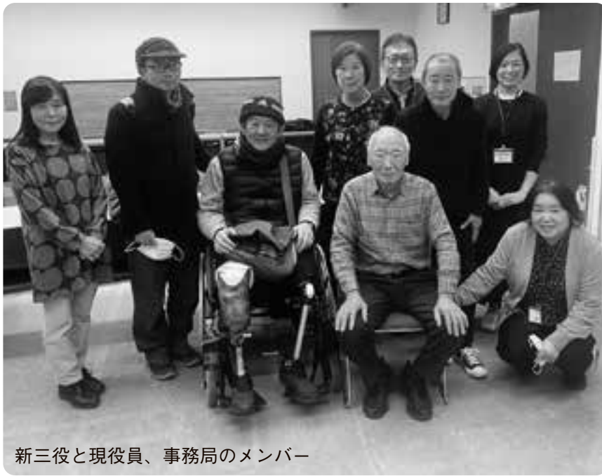
新三役と現役員、事務局のメンバー

さいたま市障害者協議会は現在十七団体が加盟しており、各団体よりの理事は二十三名おります。皆さん自分の理事の事も、なかなか三役に協力できる人がいない状況の中、手をつなぐ育成会としても内情はとても厳しいのですが、理事会で検討し、若い理事さ