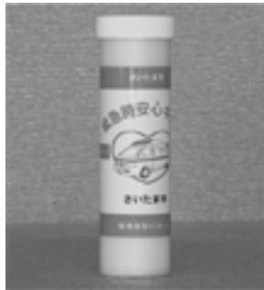
緊急時安心キット

さまざまな意見に感謝申し上げます。常日頃から障害者と健常者のコミュニケーションが大事という話があり、災害時には公助というより地域共助が非常に大事であると感じた。我々行政側も気を引き締めてやっていく。学生に対しての防災教育に関しては、教育委員会が中心となり、各学校で行っている。要配慮者への対応は教育委員会と調整しながら進めていきたい。