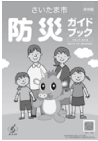
さいたま市防災ガイドブック

・防災ガイドブックを読んでも障害当事者にとって内容がよく分からないので、聴こえない人のための防災ガイドブックを作製した。障害ある、ないに関係なく誰もが分かりやすい内容のガイドブックを作るということが大切だ。