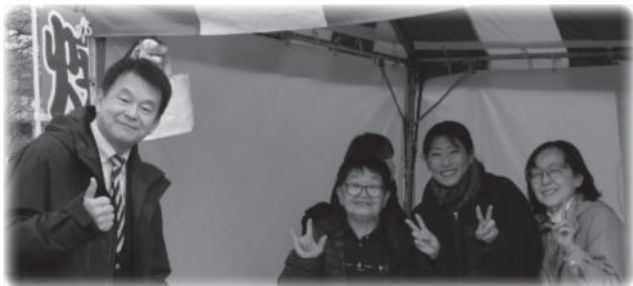
みんなの笑顔あふれる販売コーナー