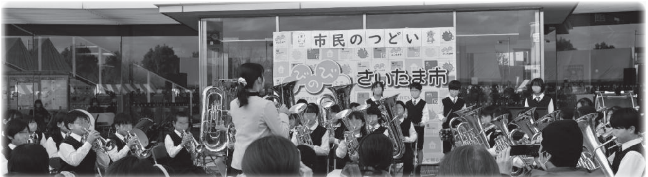
さいたま市立植竹小学校金管バンド クローバース