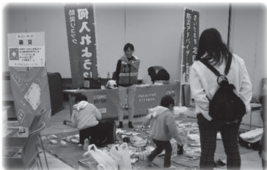
防災用品展示・防災関連ゲーム