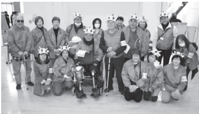
令和7年度 市民のつどい実行委員

トのステージで、日頃の練習の成果を表現する晴れやかな姿に胸が一杯になりました。色鮮やかな織物で毎年参加してくれる施設の皆さん、竹太鼓を叩く子どもたちを見守る温かい笑顔の職員さん、出番が待ちきれず音楽に合わせて踊りだす男の子・・・あつという間の三時間でした。ふれあいステージを担ってくれたボランティアさんは大学三年生の二人。底冷えする中、写真撮影や手拍子を続けた応援団。本当に感謝です。 障害がある人もない人も、会場全体で共に創り上げていく市民のつどいは、ノーマライゼーション条例の理念が広がる一日です。