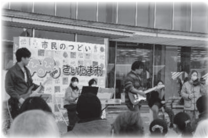
特定非営利活動法人 ゆうの樹