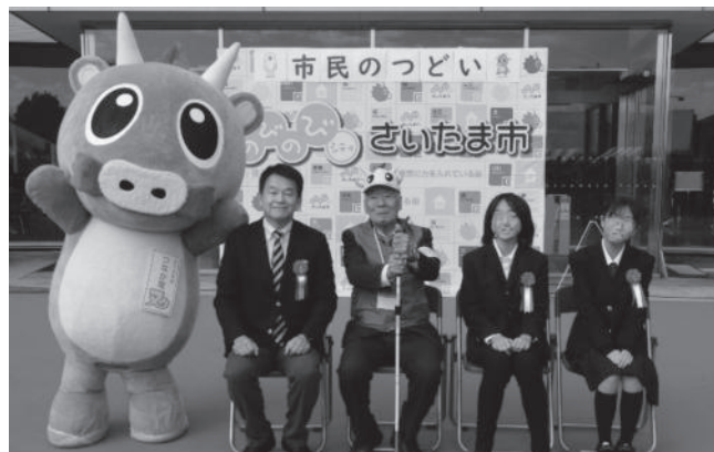
心の輪を広げる体験作文・障害者週間のポスター表彰式