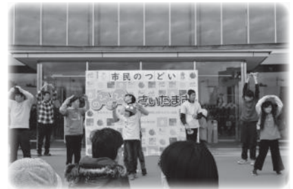
NPO法人みんなの風福社会 風の子クラブ