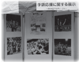
手話応援に関する展示