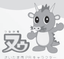
さいたま市 PR キャラクター