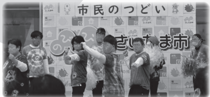
ふれあいステージ：NPO法人織の音アート・福祉協会