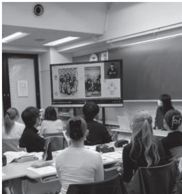
市内専門学校でのボランティア説明会

晴天に恵まれた令和七年度の市民のつどいは、入出が多く活気に溢れ、過去最高の来場者で賑わいました。このイベントには、沢山のボランティアさんが集まってくれます。私は今年ボランティアさんへの事前説明会に参加する機会がありました。障害政策課からは、イベントの概要とともに、ノーマライゼーションについての講座がありました。障害者協議会からは、知的障害・身体障害・視覚障害の実行委員が参加し、障害の特性や日頃感じていることを話す時間をいただきました。専門学校の学生さんが真剣な眼差しで真摯に耳を傾けてくれる様子が、とても有り難かったです。 当日は障害当事者の皆様と支援者による「ふれあいステージ」の進行を担当しました。こちらも過去最高の十一組の参加で盛り上がりしました。 式典が行われたレッドカーペット