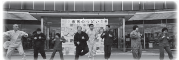
ダンスフォーラム BFクラス