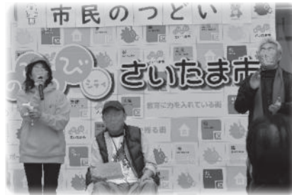
一般社団法人インクルラボ