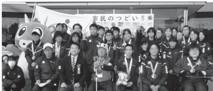
全国障害者スポーツ大会 さいたま市選手団結果報告式・解団式