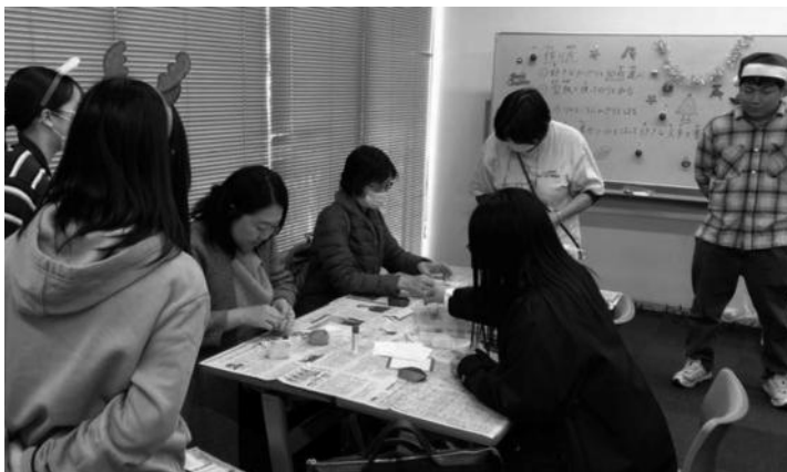
さいたま市手をつなぐ育成会：クリスマスカード作り

障害者週間は、障害者基本法によって定められています。国民の間に広く基本原則に関する関心と理解を深めるとともに、障害者が社会、経済、文化その他あらゆる分野の活動に参加することを促進することを目的としています。