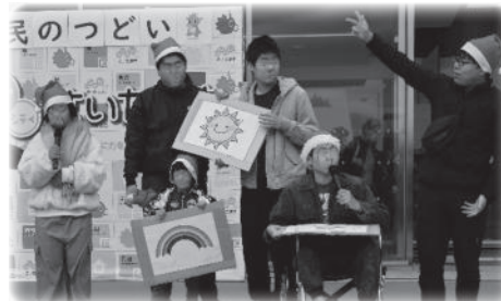
久美愛園 久美学園