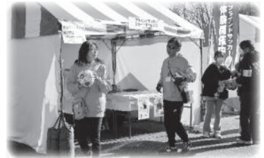
ブラインドフットボール体験