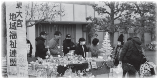
障害者団体・事業所販売コーナー