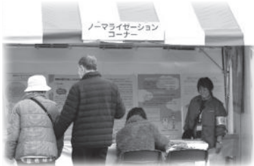
ノーマライゼーションコーナー