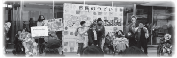
社会福祉法人さくら草 デイセンターさくら草