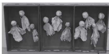
力作ぞろいの作品展