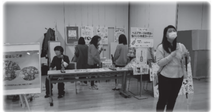
ヘルプマーク普及コーナー