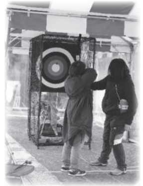
アーチェリー体験