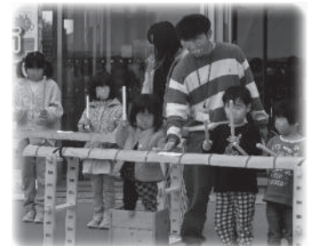
一般社団法人とまりぎ BOOK