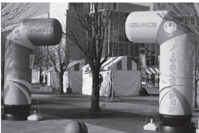
市民広場にノーマライゼーション啓発のゲートが設置されました

さいたま市では、二〇一一年全国の政令指定都市に先駆けて「さいたま市誰もが共に暮らすための障害者の権利の擁護等に関する条例」を制定しました。 この条例は障害がある人もない人も、安心して生活できる地域社会を目指すもので、障害のある人が地域の一員として様々な活動ができるまちづくりを目指しています。